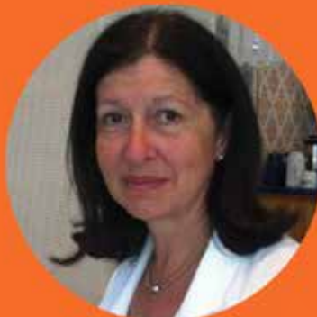
Vistoria Strand Ship to Gaza Rebellmammorna