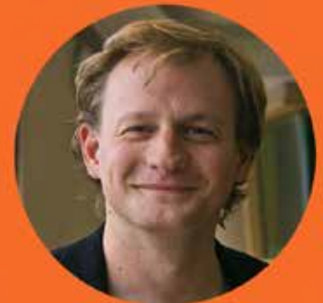
Carl Schlyter Klimat och systemförändring Greenpeace