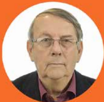
Pär Granstedt fd riksdagsledamot