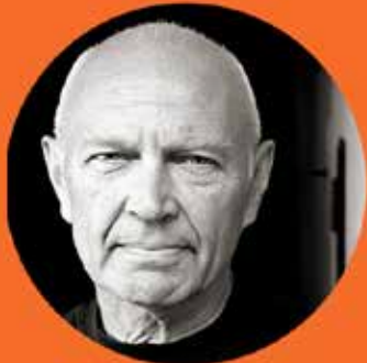
Pierre Schori fd FN ambassadör

kl 17:30 23/9 Café Blå, Lunagallery, Södertälje Stadsbiblioteket